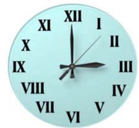
Reloj con números romanos