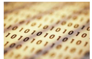
Cifras del sistema binario

El sistema de base 2 o sistema binario también es muy utilizado hoy en día, sobre todo en los ordenadores y calculadoras debido a su simplicidad, ya que para escribir números en este sistema solo se necesitan dos cifras distintas: el 0 y el 1