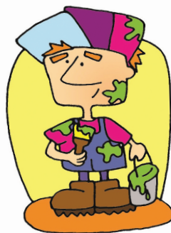
3. Il est peintre