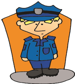
5. Il est policier