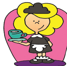
8. Elle est La femme de ménage