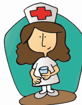
4. Elle est infirmière