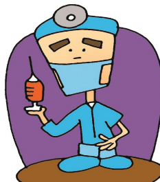
7. Il est docteur