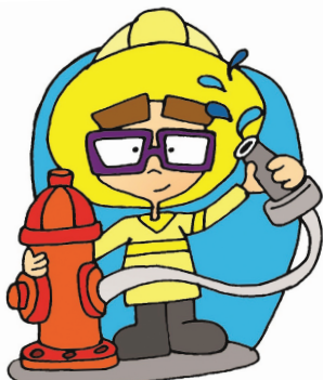
1. Il est pompier