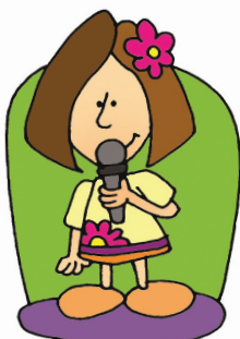
2. Elle est chanteuse