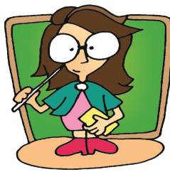
6. Elle est professeur