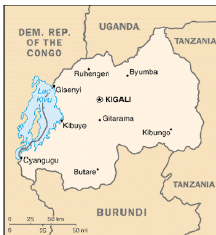
Ruanda y alrededores

En este contexto aparecen los belgas, que habían gobernado Ruanda apoyándose en los tutsis. Al principio, la relación parecía ser provechosa, hasta que empezaron las olas de protestas anticoloniales en África por la independencia. El problema para Bélgica radicaba en que los tutsis eran los principales interesados en desvincularse del país europeo. En respuesta a la posición independentista de los tutsis, los belgas empiezan a apoyar a los hutus, más sumisos y dispuestos a compromisos. Así, empieza la iniciación de los hutus contra los tutsis, acción apoyada en ese momento por la misma Bélgica y animada por la sublevación campesina de 1959. Los campesinos quemaron las fincas de sus amos y siguieron con la matanza de miles de tutsis. Como consecuencia, miles de víctimas tutsis tuvieron que exiliarse a países vecinos como Uganda, el Congo, Tanzania o Burundi. La antigua casta aristocrática perdió entonces su posición dominante y el poder pasó a manos del campesinado hutu, que proclamó la independencia de Ruanda en 1962. De esta manera, se crea la tragedia ruandesa: a causa de la imposibilidad de reconciliación entre dos comunidades que reclaman el mismo territorio.