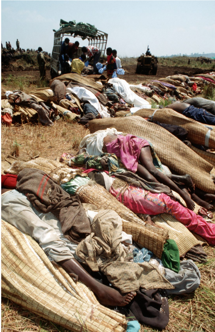
Las víctimas de la masacre

El libro “Una temporada de machetes” de Jean Hatzfeld reúne los testimonios de un grupo de amigos hutus, que fueron responsables de una multitud de asesinatos tutsis durante el genocidio.