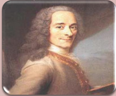
François Marie Arouet (Voltaire)