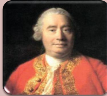
Juan Jacobo Rousseau