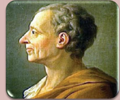
Charles de Secondat barón de Montesquieu