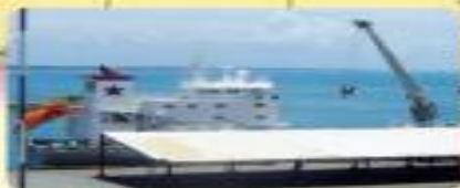
Efectos políticos y económicos de la Segunda Guerra Mundial.