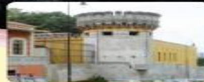
Constitución de 1949 y nuevo modelo de Estado.