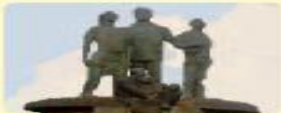
Reforma Social de los años cuarenta.