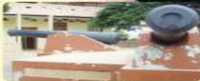
Guerra Civil de 1948.