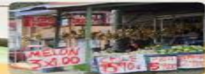
Repercusiones sociales, políticas y económicas de la depresión de los años treinta.