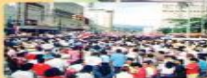
Influencia de las organizaciones sociales y políticas en la reforma del Estado liberal.