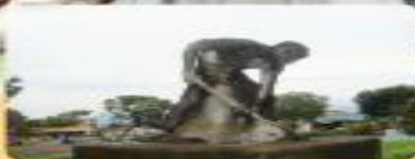
Decadencia del Estado y de la economía liberal.