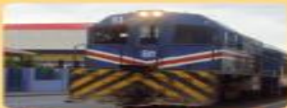
Efectos de la Primera Guerra Mundial en Costa Rica.