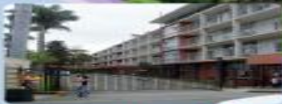
Características de la natalidad y la mortalidad en Costa Rica.