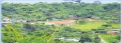
Distribución geográfica de la población.