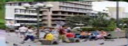
Características e impacto de la migración en Costa Rica.