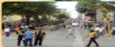
Regiones socioeconómicas según MIDEPLAN.