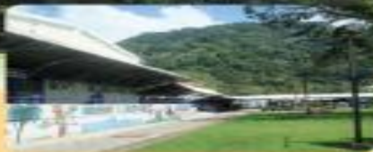
Criterios para definir una región.