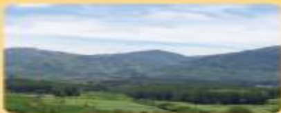
Tipos de regiones