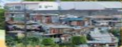
Problemática de las regiones socioeconómicas.