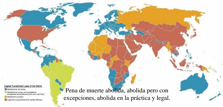
La pena de muerte en el mundo.

El partido único se confunde aquí con el aparato del Estado, al frente del cual se sitúa un presidente que es a la vez líder del partido, jefe religioso o dirigente del grupo oligárquico establecido en el poder. En este contexto, la violencia es el medio más frecuente de relación entre el gobierno y sus opositores. Los movimientos armados se convierten en la única salida de una oposición que no dispone de recursos democráticos para expresarse ni de garantías democráticas para alcanzar el poder. En contraposición, el Estado legitima la violencia institucional como único medio para mantener orden social.